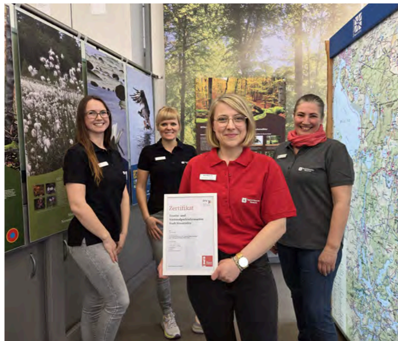
DTV-zertifiziert: Tourist- und Nationalparkinformation mit i-Marke.

Mitten im Herzen der Stadt, nur wenige Schritte vom Markt und Rathaus entfernt, beginnt das Abenteuer Neustrelitz in der Tourist- und Nationalparkinformation. Hier eröffnen sich Einblicke in die Vielfalt der Region, wertvolle Tipps für Ausflüge und Touren sowie Inspiration für besondere Erlebnisse. Ob ein gemütlicher Aufenthalt, spannende Stadtführungen, abwechslungsreiche Rad- und Wandertouren oder besondere Veranstaltungen – Neustrelitz hält für jede und jeden besondere Momente bereit.