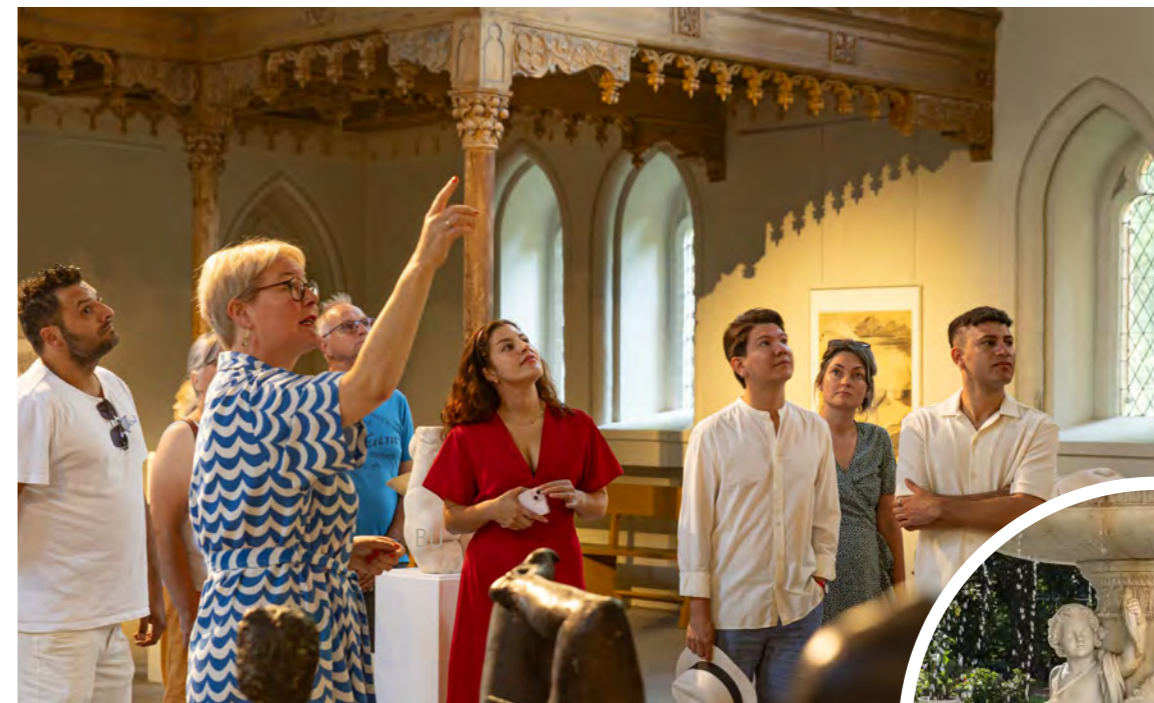
Stadtführung in der Schlosskirche