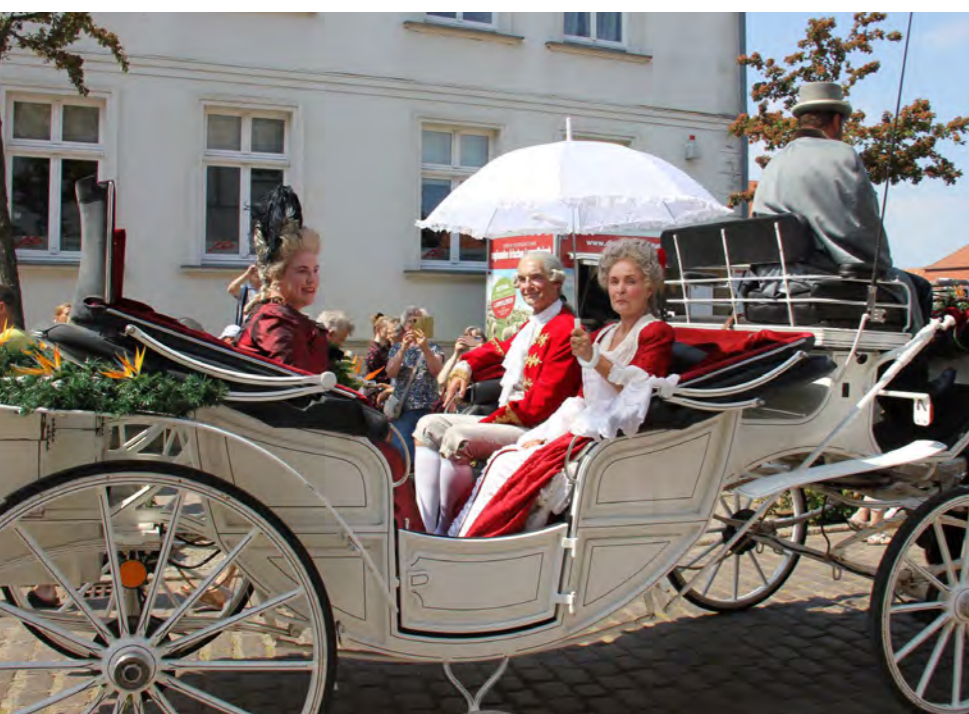
Strelitzienfest „Adels Kutsche“