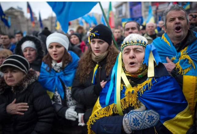
Menschen während der Proteste auf dem Maidan, 2013

Dabei ging es der russischen Führung nicht nur um die „Ukraine in der Nato“, sondern mehr noch um die „Nato in der Ukraine“. Russland wollte verhindern, dass direkt vor der eigenen Türschwelle Strukturen der Nato geschaffen werden. Doch die USA wollten die Destabilisierung Russlands, insbesondere nach den Demonstrationen 2013/14 auf dem Maidan von Kiew. Nach der Annexion der Krim wurde Russland aus den G8 ausgeschlossen. Der damalige US-Präsident Barack Obama begann mit Waffenlieferungen. Die Medien in Europa schwenkten auf einen russlandfeindlichen Kurs um, in der Politik war das nicht anders. In Russland selbst kam es zur Verschärfung der Repression gegen politische Gegner und zu einem Neonationalismus von den Medien bis zur Änderung der Verfassung. Europa entwickelte sich auseinander.