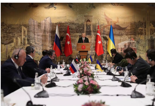
Erdogan hält eine Rede zur Begrüßung der russischen (!) und ukrainischen Delegationen, 2022.

Das Versagen der EU zeigt sich vor allem darin, selbst bis heute, bis zum dritten Jahrestag des russischen Angriffskriegs, keinen ernsthaften Friedensvorschlag gemacht zu haben. Drei Jahre gab es, manchmal nach heftigem Hin und Her, nur Waffenlieferungen. Auch die Pläne von Brasilien und China, zwei Länder, die durch ihre Zugehörigkeit zu den Brics-Staaten erheblichen Einfluss auf Putin haben, wurden nicht aufgegriffen. Im Gegenteil: Der britische Premier Boris Johnson hat auch in der Ukraine eine unselige Rolle gespielt, als er persönlich dem ukrainischen Präsidenten Selenskyj abgeraten hat, den am 29. März 2022 in Istanbul mit Russland verhandelten Friedensplan weiterzuverfolgen. Den Menschen in der Ukraine und den Soldaten auf beiden Seiten wären vielleicht drei Jahre Krieg erspart geblieben.